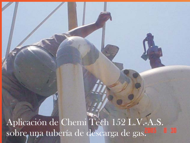
Aplicación de Chemi Tech 152 L.V.-A.S. sobre una tubería de descarga de gas.