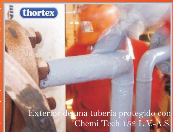
Exterior de una tubería protegido con Chemi Tech 152 L.V.-A.S.

Una de las mayores ventajas del Chemi Tech 152 L.V.-A.S. se encuentra en la posibilidad de aplicarlo en condiciones de humedad y en completa inmersión. Estas circunstancias no afectan el desempeño del recubrimiento, siendo ideal para aplicarlo en tuberías afectadas por condensación.